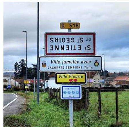
Saint-Michel, Brion, Brezins, Saint-Étienne... : ici aussi, les panneaux étaient "tout retournés" !