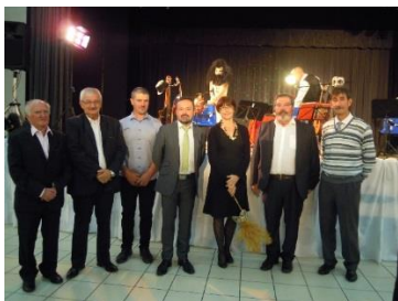
Nos élus, le président du Comité et les représentants du Comité de jumelage italien

En 2018 on retrouvera les manifestations traditionnelles du Comité. De nouveaux projets sont en cours d'élaboration dont la venue possible des élèves italiens pour rencontrer leurs homologues stéphanois. Nous vous tiendrons informés de nos actions qui pourront vous intéresser et auxquelles vous aurez envie de participer. Nous vous souhaitons une belle année 2018 placée sous le signe de l'amitié et des rencontres franco-italiennes.