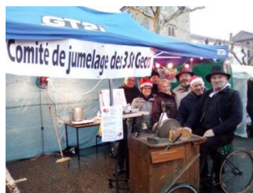
Le Comité de jumelage au marché de Noël