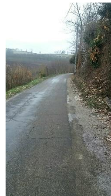
Route de St Geoires (direction Molézin)

Nous avons aussi repeint les murs intérieurs de la Mairie pour 3 528 € et rénové la salle du Conseil, murs et sols pour 8 496 €, ces travaux ont été effectués par EARL DICO.