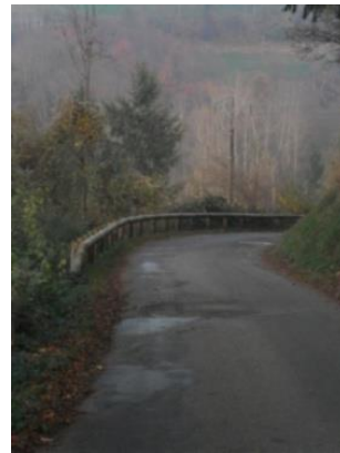
Barrière de sécurité à Mon Coeur

D'autres travaux ont également été réalisés avec :