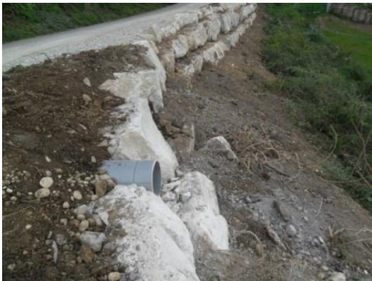
Travaux réalisés à La Combe

Ce que nous nous sommes empressés de faire en montant les dossiers pour les barrières de sécurité et l'enrochement de la Combe où nous avons pu prétendre à 50 % plus 10 % bonus du Département auquel se rajoute les 20 % de la DETR (Dotation d'Équipement des Territoires Ruraux) soit un total de 80 %.