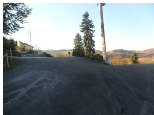
Virage des Envers

Après consultation, c'est l'entreprise Gachet qui a été retenue pour l'ensemble de ces ouvrages.