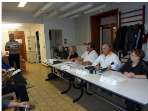
M. le Maire et le bureau du Comité de jumelage

mars. Les membres et sympathisants du Comité sont invités à Casorate Sempione pour la fête de la San Tito en septembre. Le bureau a été reconduit et M. le Maire de St Michel de St Geoirs en a profité pour féliciter le Comité pour son implication. Tous ceux qui désirent participer à ces échanges sont les bienvenus et nous envisageons une année 2016 prometteuse.