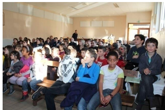
Spectacle de Noël du 12 décembre