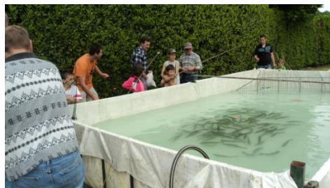
Fête de la pêche 2015

Fête de la pêche le samedi 11 juin prochain sur la place du terrain de boules de St Michel de St Geoirs.