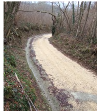
Rénovation du chemin du Gabet