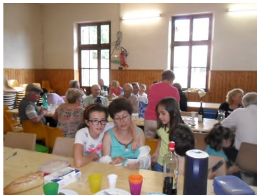
Le repas pique-nique à l'intérieur à cause du mauvais temps