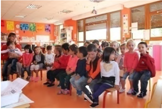
la petite et moyenne section