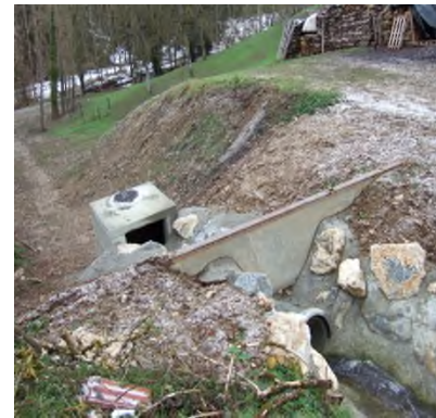
Ci-dessus les travaux réalisés à La Combe