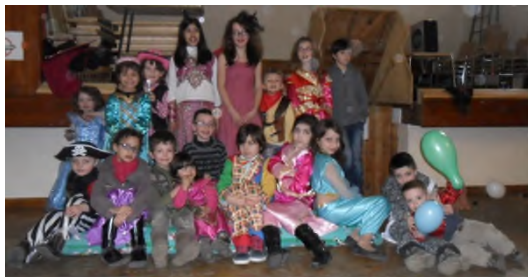
Le carnaval avec les enfants des côteaux

Que cette nouvelle année 2015 soit pour vous chers lecteurs et lectrices remplie de joie et de bonheur.