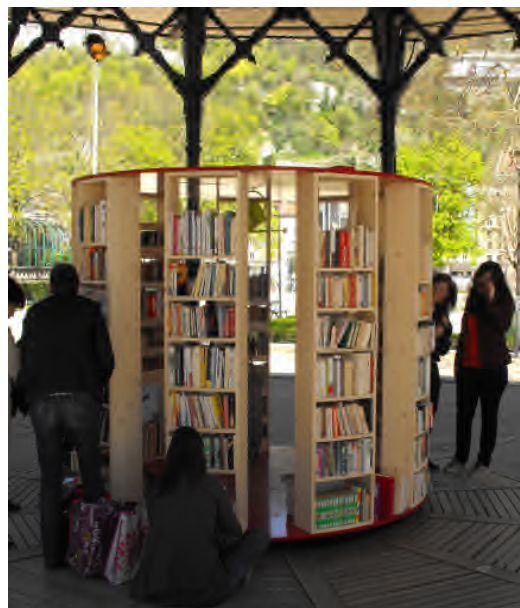
Photo : Réalisation d'une bibliothèque pour le printemps du livre à Grenoble.

En 2015, l'association investit dans un système de sonorisation, elle poursuit son activité de récupération et de transformation d'objets lumineux, sonores, et répond à des commandes de création de machinerie ou d'éléments de décor.