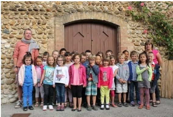
la grande section et le CP