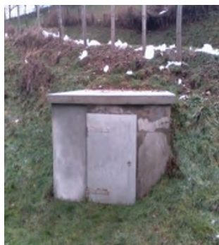
Le toit du captage d'eau au lieudit "La Chessière" a été refait par Gelas Construction.

Des travaux sur les réseaux électriques ont été effectués avec le déplacement du transformateur du secteur du "Beu" suite à des problèmes de chutes de tension. Les travaux ont été conduits et pris en charge par le SEDI.